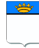
Saluces du Castellar