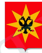
Sade après 1416

L'empereur Sigismond accorde, en 1416, à Elzéar, échanton du pape, le privilège de porter, sur l'étoile de ses armes de sa maison une aigle éployée de sable, membrée, becquée et diadémée de gueules ; l'écu timbré d'un casque taré de front et pour cimier un croissant d'argent soutenant l'étoile de Sade remplie de l'Aigle de l'empire.