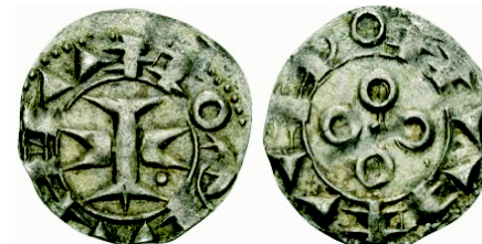
Denier de Melgueil

Pendant la croisade des Albigeois, le comté de Mauguio est confisqué par l'Eglise (1211). Il sera repris par Raymond VII en 1222, puis restitué à l'Eglise en 1224 (concile de Montpellier).