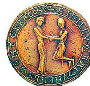
Sceau de Raymond de Mondragon : Hommage à la dame.

Note : Mondragon s'écrit aujourd'hui sans un "t". On trouve les deux écritures dans les actes.