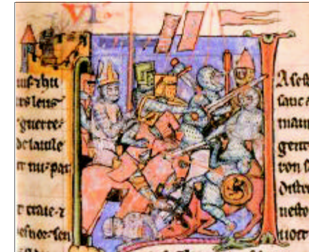
La Sainte lance , portée par Adhémar du Puy , devant Antioche (enluminure du XIIIe siècle, BL MS Yates Thompson 12, f. 29).

Fin octobre 1095, c'est le départ de l'armée des Provençaux avec Raymond de St Gilles, sa femme Elvire et son fils. La croix de Toulouse devient l'emblème officiel des Provençaux, leur signe de ralliement. Selon certains, ils sont 100.000 à passer les Alpes au Mont Genève. Ils traversent l'Italie du Nord, la Dalmatie, l'Albanie, coupent par la Macédoine pour arriver en avril 1097 en Thrace, puis le 22 avril à Constantinople (Istanbul). A Constantinople, ils rejoignent les croisés de Godefroy de Bouillon et ceux de Bohémond. Ces derniers prennent Nicée dès le 6 mai 1097, alors que Raymond traverse le Bosphore le 10 mai pour rejoindre un contingent de Méridionaux : Gaston de Béarn, les comtes du Forez, de Montpellier, du Roussillon et d'Orange.