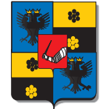
Guyard de Saint-Julien (1)