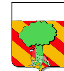
Lingua de St-Blanquat