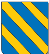
D'azur à trois bandes d'or.