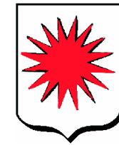
D'argent à la comète à seize rais de gueules