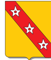
D'or à la bande de gueules chargée de 3 molettes d'éperon d'argent.