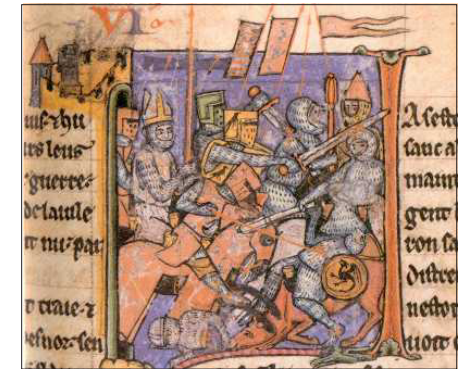
La Sainte lance , portée par Adhémar du Puy, devant Antioche (enluminure du XIIIe siècle, BL MS Yates Thompson 12, f. 29).

Adhémar de Grignan : "Christus rex venit in pace et homo factus est"