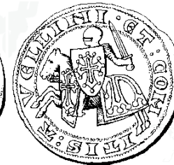
Sceau de Bertrand II