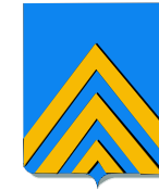
D'azur à trois chevrons d'or.

Pierre de Raffélis secrétaire des commandements de Louis II d'Anjou