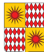
Grimaldi de Beuil

Ecu : fuselé d'argent et de gueules, entouré du Collier de l'Ordre de Saint-Charles. Manteau de gueules doublé d'hermine sommé d'une Couronne Princièrè. Banderole avec la devise: DEO JUVANTE. Tenants : deux Frères Mineurs portant chacun une épée levée.